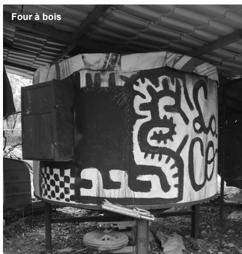
Four à bois